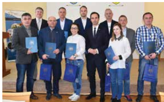
Pozyskane dofinansowanie pomoże klubom w dalszym rozwoju