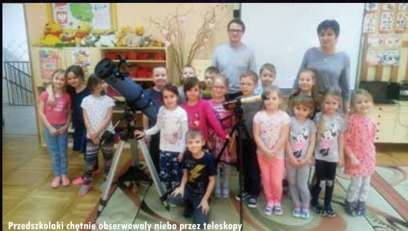
Przedzkolaki chętnie obserwowali niebo przez teleskopy