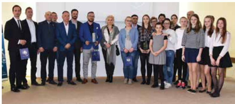
Laury Sportowe to wyjątkowe nagrody, dla najwybitniejszych sportowców